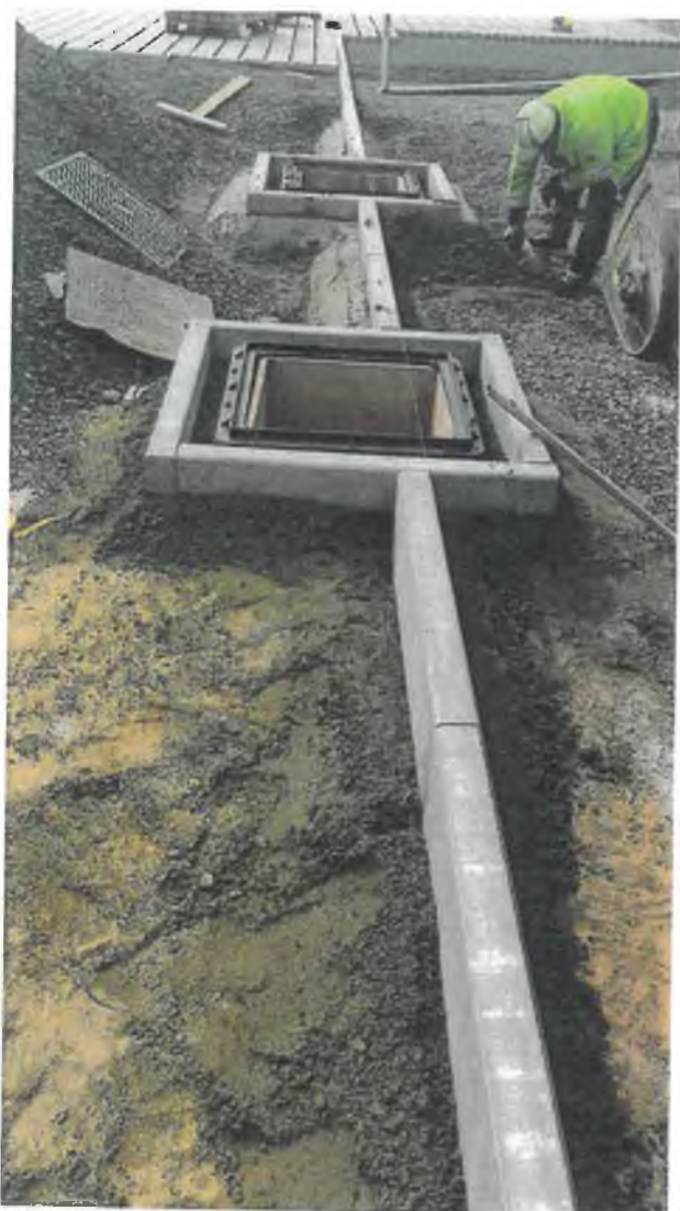
Pohled na šachty